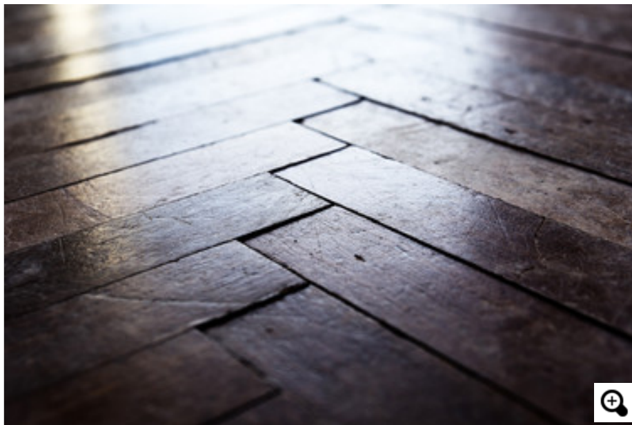
Sildebensmønstreret fra gulvet i Børsen er bevaret i Børsen Bordet.