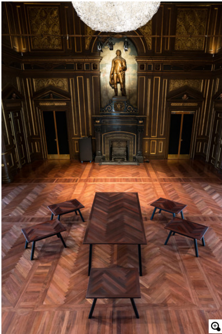
Det første Børsen Bord (i midten) står i vante omgivelser, da det er Børsen selv, der har købt det.